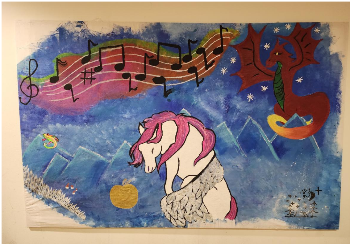
Gemeinsames Werk von Patient:innen aus dem Behandlungszentrum Sucht im Rahmen der Kunsttherapie (2023)